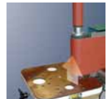
Регулируемый по высоте рабочий стол