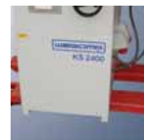
Возможность перемещения станка с помощью подъемной тележки.