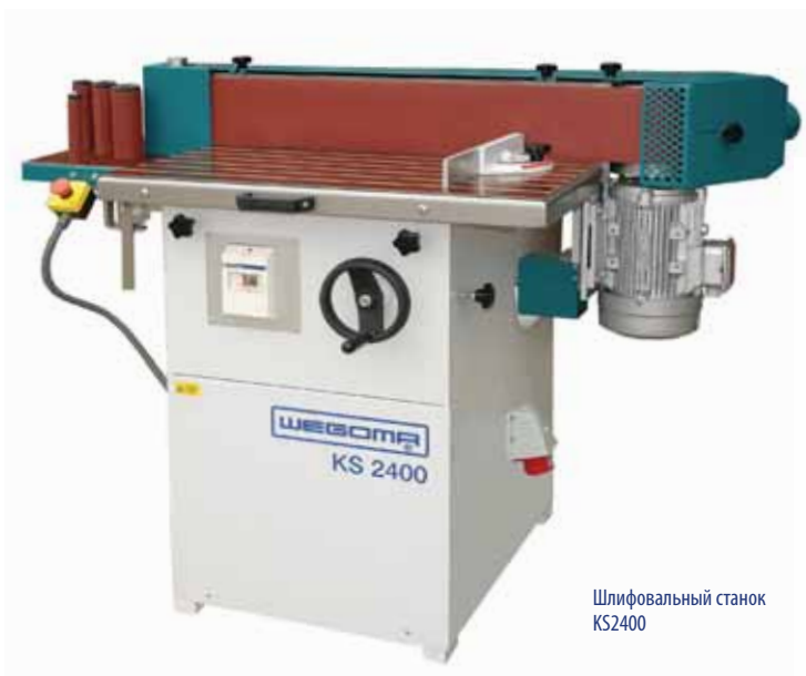
Шлифовальный станок KS2400