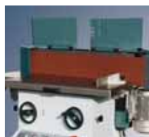
Возможность переоборудования в шлифовальный станок для обработки древесины