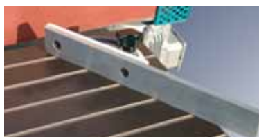
Оснащен угловым упором большого размера