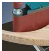
Шлифование на натяжном валке ленты.