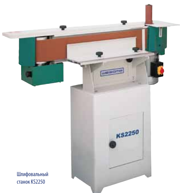
Шлифовальный станок KS2250