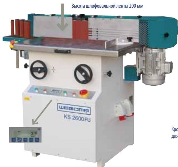
Кромко-шлифовальный станок для обработки шпона KS2600FU