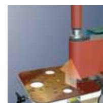
Регулируемый по высоте рабочий стол.