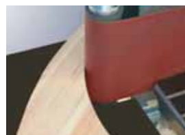
Шлифование на натяжном валке ленты.