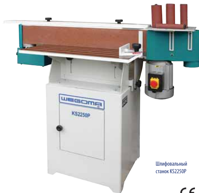
Шлифовальный станок KS2250P