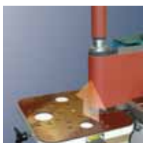
Регулируемый по высоте рабочий стол.