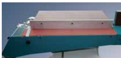
Угол наклона шлифовального узла от минус -10° до 90°.