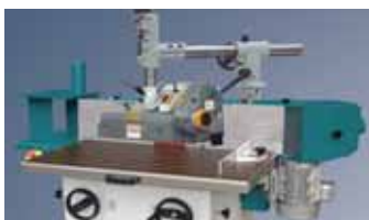
Кромко-шлифовальный станок KS2600FU с автоподатчиком WEGOMA (не входит в комплект поставки).